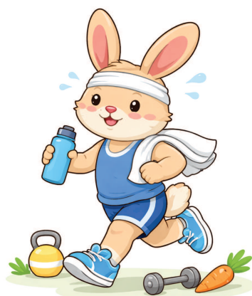
KI generiertes Bild

Vor allem mit Familie oder Freunden wird Bewegung oft leichter und motivierender.